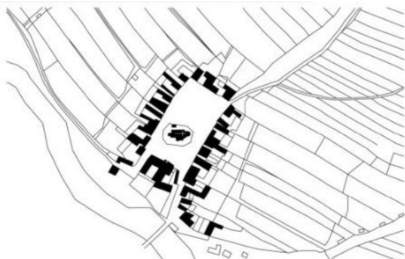
Nahvrzowe/ Dolní Vltavice

V roce 1530 mohla obdržet Dolní Vltavice právo městyse, což bylo tehdy spojeno s povinným opevněním města proti vnějšímu nepříteli. Tenkrát se to nepovedlo, ale obezdil se kostel po celém obvodu zdí dva metry vysokou a metr širokou, což neměl tehdy žádný kostel v celém širém okolí. Stačilo to, protože do obezděného prostoru se mohlo ukrýt všechno tehdejší obyvatelstvo městyse.