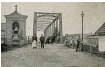
MOST PŘES ŘEKU – VLEVO SV. JAN NEPOMUCKÝ – ROK 1906