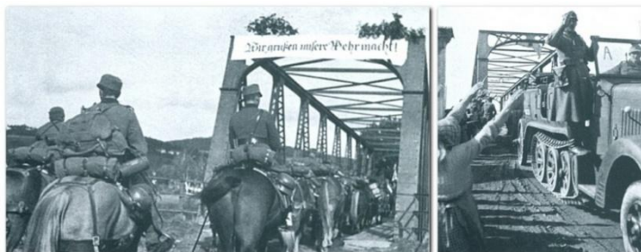
Německá branná moc vjíždí dne 1.října 1938 přes most do Dolní Vltavice, kde je vítána místními občany

Celá naše oblast se stala součástí nejprve Zemského hejtmanství Horní Podunají se sídlem v Linci, které bylo k 1.květnu 1939 přeměněno v říšskou župu Horní Podunají.