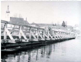
DŘEVĚNÝ MOST PŘES ŘEKU VLTAVU